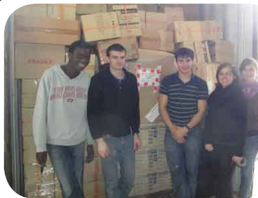
Etudiants impliqués dans le projet