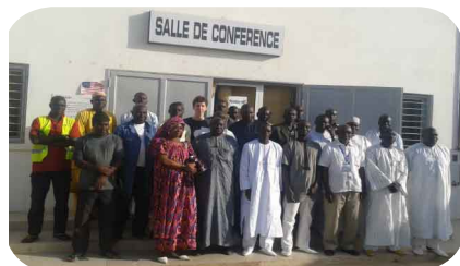
Le groupe de soignants de l'hôpital de Thiès après la réception des colis.